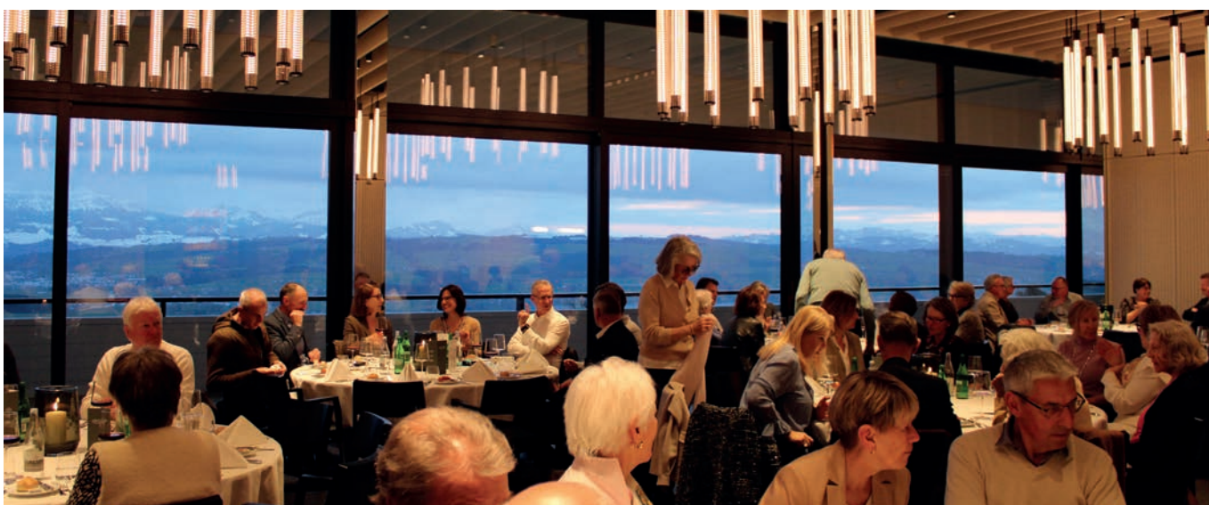
Bei angenehmer Abendstimmung geniessen die Teilnehmerinnen und Teilnehmer der 31. Ordentlichen Generalversammlung das gemeinsame Dinner.