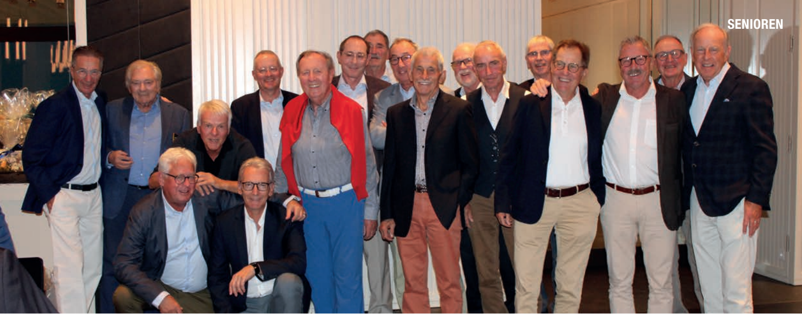
Happy Birthday – die Senioren des Golf Club Sempachersee am Geburtstagsturnier im September 2025