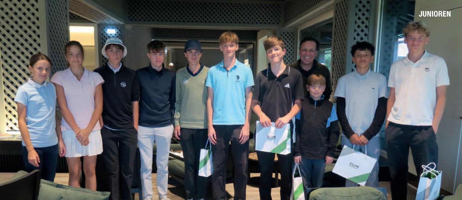
Die Juniorinnen und Junioren an der Preisverleihung der Junioren Meisterschaften 2025