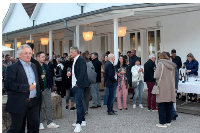
Teilnehmerinnen und Teilnehmer der 23. Ordentlichen Generalversammlung beim Apéro auf der Terrasse des Restaurants «La Gloria».

Um 19.36 Uhr schloss Marcel von Arx die 23. Ordentliche Generalversammlung. Im Anschluss kamen die Mitglieder in den Genuss eines hervorragenden Abendessens im Restaurant «La Gloria» und liessen den Abend bei angeregten Gesprächen ausklingen.