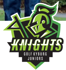
Ein erfolgreicher Saisonabschluss für die Juniorinnen und Junioren des Golf Club Kyburg im Oktober 2025.