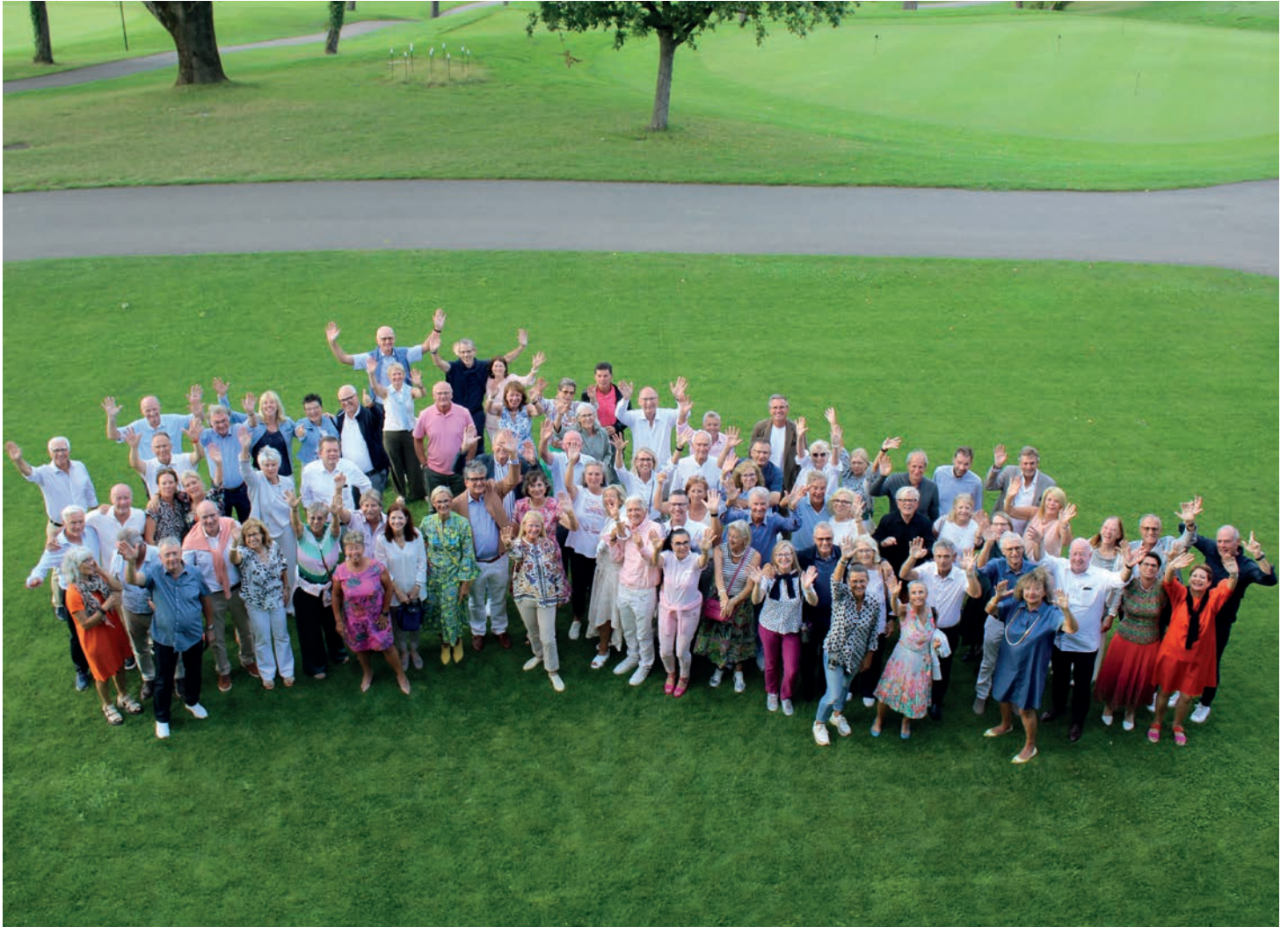
Die Mitglieder des Golf Club Saint Apollinaire – gemeinsam auf und neben dem Platz

GOLF CLUB SEMPACHERSEE CH-6024 Hildisrieden Tel +41 41 462 71 71 www.golf-sempach.ch