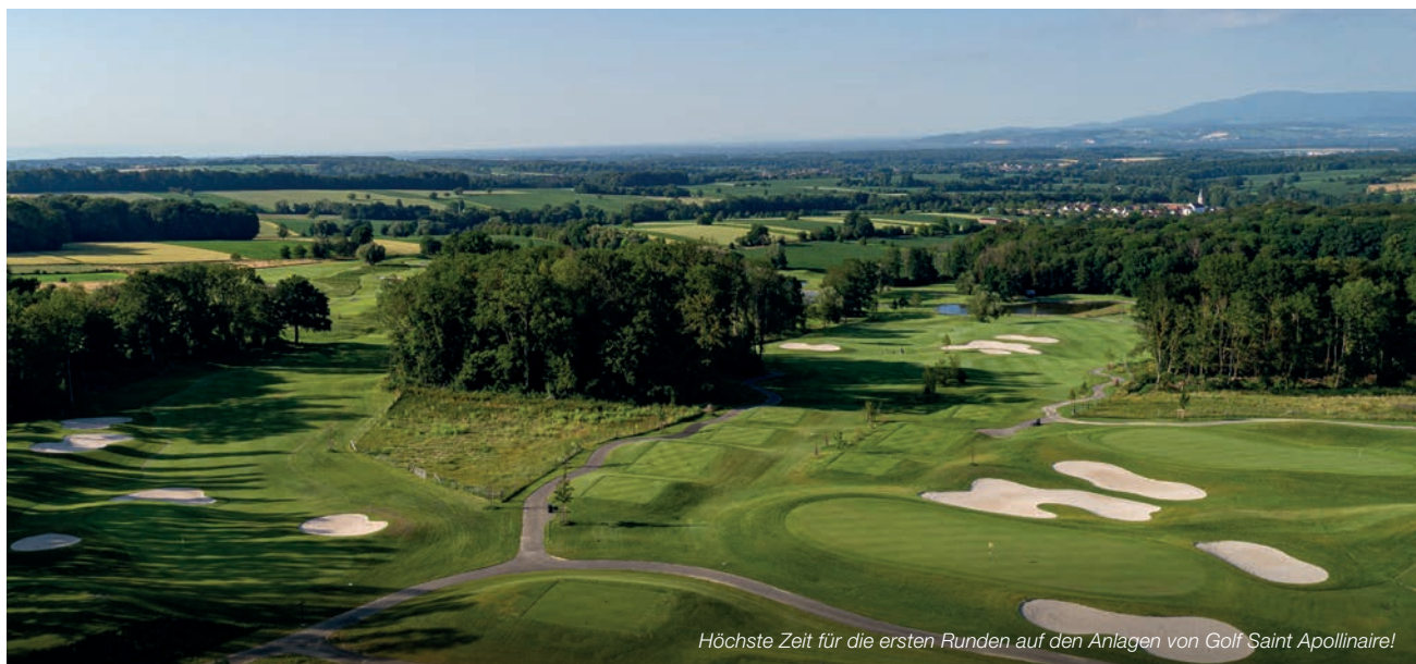
Höchste Zeit für die ersten Runden auf den Anlagen von Golf Saint Apollinaire!