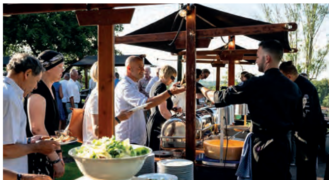
Kulinarisch verwöhnte das Team des Restaurants «Das Refektorium» an mehreren Genussstationen mit frisch zubereiteten Highlights.

Am Abend hielt das Küchenteam des Restaurants «Das Refektorium» ein vielseitiges kulinarisches Angebot für die Gäste bereit. Serviert wurden Spezialitäten aus aller Welt: Von asiatischen Gerichten über italienische Klassiker, bis hin zu Meeresfrüchten und ganzen Ochsenhaxen vom Grill war alles dabei. Zum Schluss liess ein reichhaltiges Dessertbuffet keine Wünsche offen.