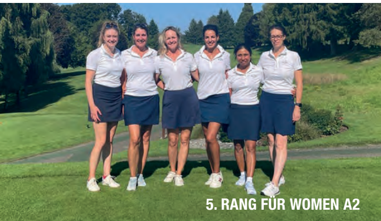
5. RANG FÜR WOMEN A2