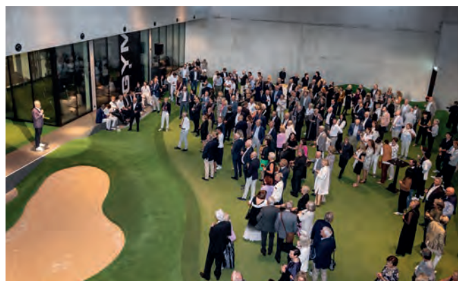
Apéro im Performance Center – der gelungene Auftakt zum Galaabend

Ein Höhepunkt jagte den nächsten: Gegen Ende des Abends brachte die vielfach ausgezeichnete Schweizer Band 77 Bombay Street den Ballsaal zum Beben. Auch als DJ Florian Seitz im Anschluss übernahm, blieb die Stimmung bombastisch – getanzt wurde bis weit nach Mitternacht, trotz des frühen Beginns. Zum Abschied wartete ein edles Give-Away als Erinnerung an ein unvergessliches Jubiläum!