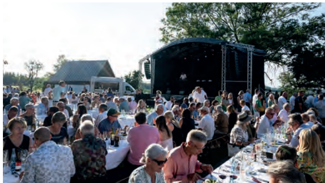
Die Mitglieder des Golf Club Saint Apollinaire geniessen die kulinarischen Köstlichkeiten und die gemeinsame Zeit.