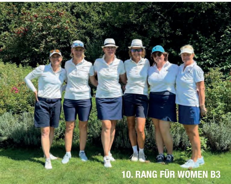
10. RANG FÜR WOMEN B3