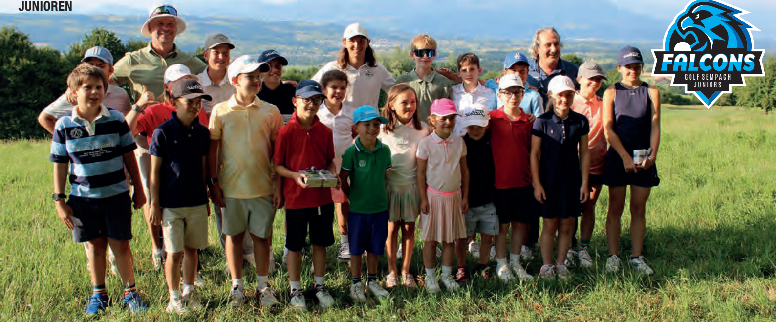
Zahlreiche Juniorinnen und Junioren nahmen am Summer Camp 2025 auf Golf Sempach teil und teilten an ihren Fähigkeiten.