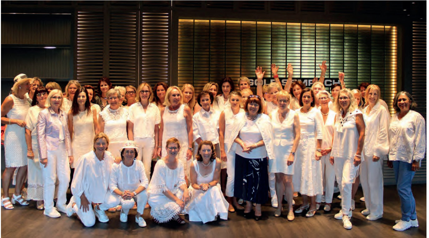
Gemeinsam unschlagbar – die Ladies des Golf Club Sempachersee an der Ladies Summerparty Ende Juli 2025