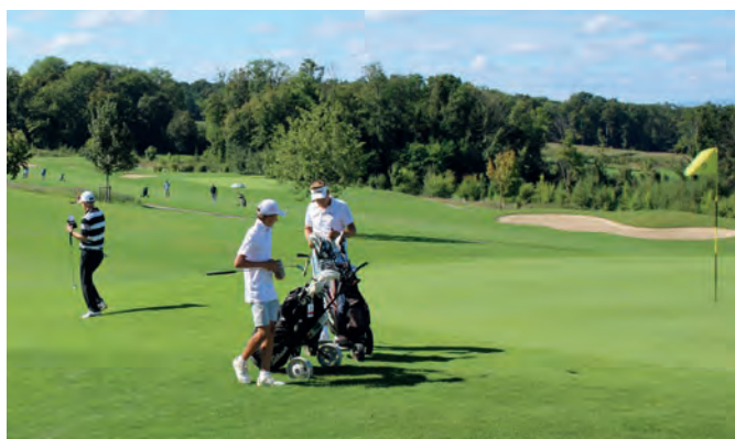
Mit viel Motivation und Spielfreude gingen die Golfsportlerinnen und Golfsportler des Golf Club Saint Apollinaire auf ihre Runde.

Herzliche Gratulation an alle Siegerinnen und Sieger!