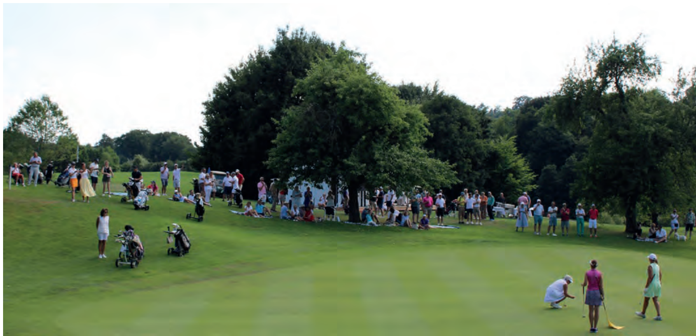
Die Zuschauerinnen und Zuschauer verfolgen gespannt das Geschehen der Clubmeisterschaften 2025.