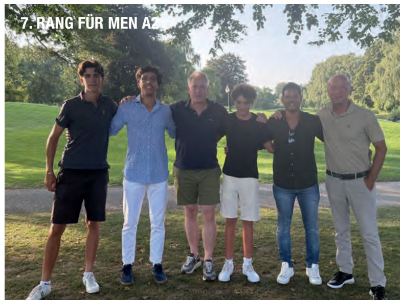
7. RANG FÜR MEN A2