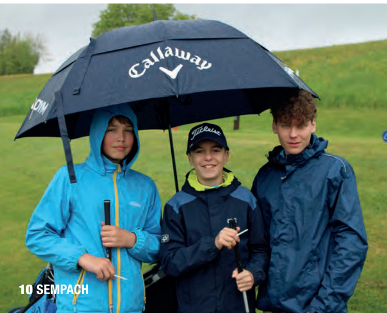
Die Juniorinnen und Junioren während der Swiss Challenge 2025 im Performance Center auf Golf Sempach.