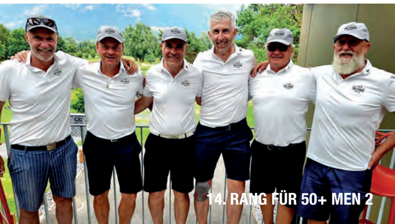
14. RANG FÜR 50+ MEN 2