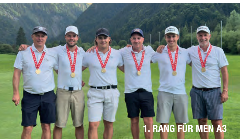
1. RANG FÜR MEN A3