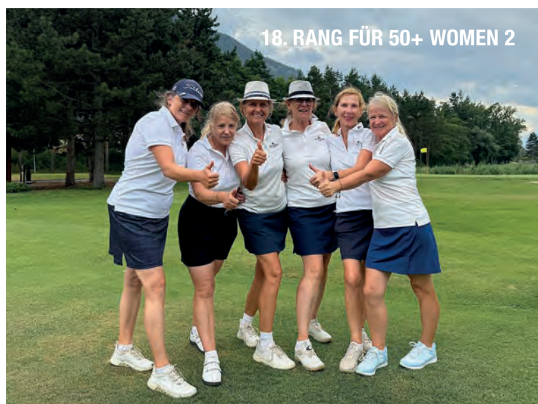
18. RANG FÜR 50+ WOMEN 2