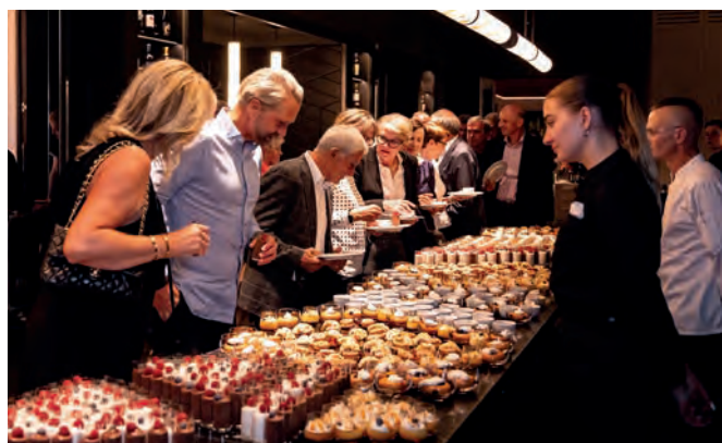
Kulinarische Highlights und besondere Genussmomente – ein Fest für alle Sinne

Drei klassisch französische Gänge, serviert durch das Team des Restaurants «Le Club», und ein Dessertbuffet voller Köstlichkeiten