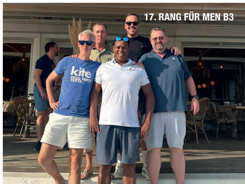
17. RANG FÜR MEN B3