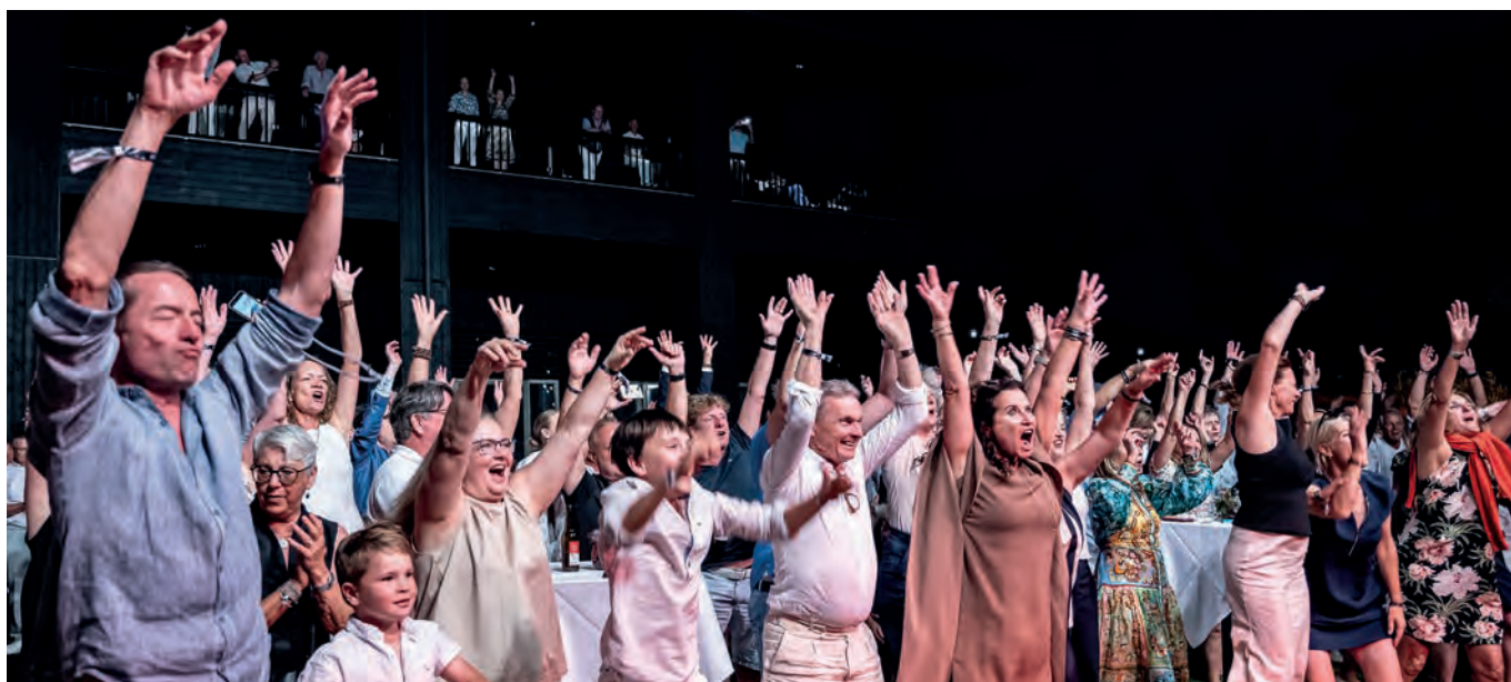
Die musikalischen Darbietungen sorgten bis tief in die Nacht für eine volle Tanzfläche und eine mitreissende Atmosphäre.

Ein besonderes Highlight folgte um 22.00 Uhr – Bligg, einer der erfolgreichsten Musiker der Schweiz, begeisterte mit einem exklusiven Privatkonzert und sorgte für ausgelassene Stimmung. Danach übernahm DJ Florian Seitz mit Beats bis tief in die Nacht - bei voller Tanzfläche und fantastischer Atmosphäre.