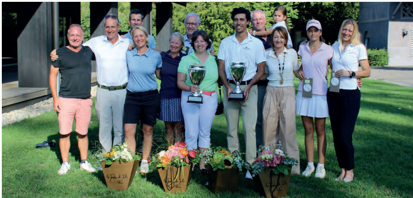
Die stolzen Siegerinnen und Sieger der Clubmeisterschaften 2025 auf Golf Saint Apollinaire.