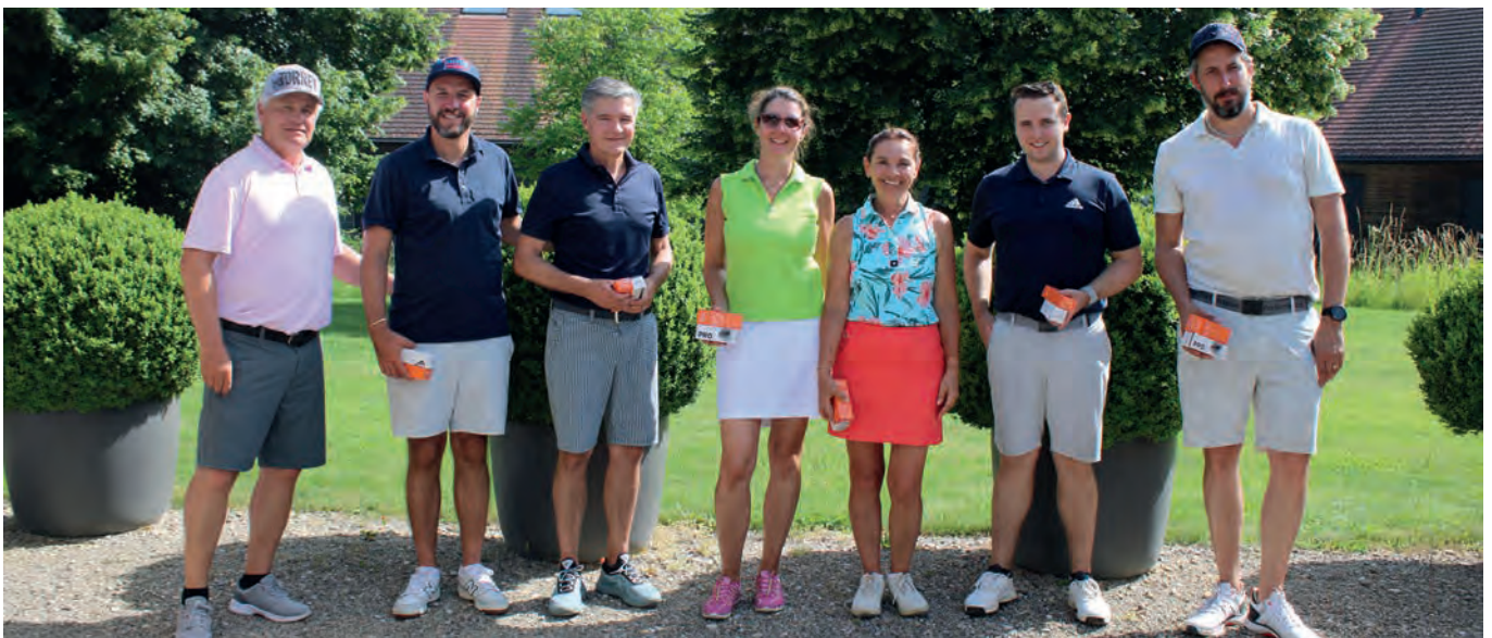
Die Gewinnerinnen und Gewinner der Kyburg Trophy feiern den Abschluss eines erfolgreichen Turniertages im Juni 2025 auf Golf Kyburg.