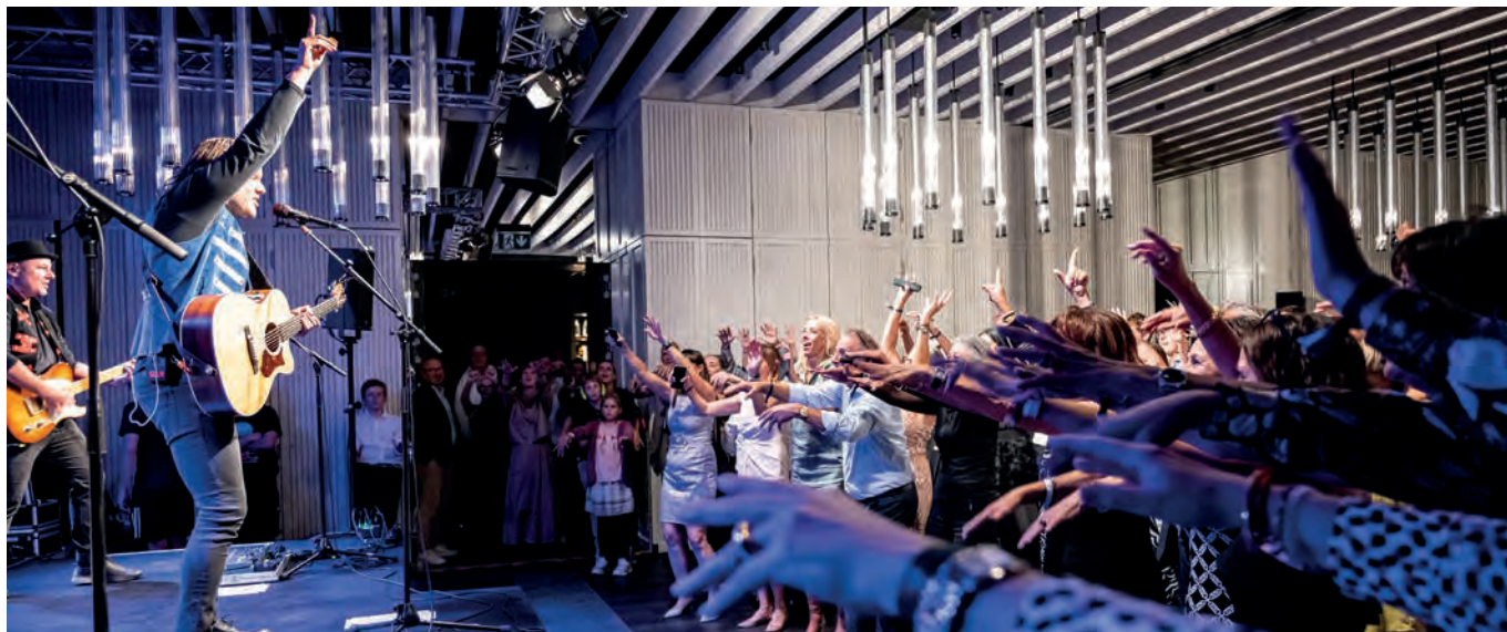
Von sanften Klängen bis hin zu Partybeats – die Schweizer Erfolgsband 77 Bombay Street riess die Mitglieder von ihren Stühlen.