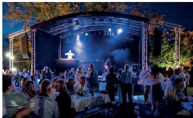
Cooler Beats von DJ Florian Seitz begleiteten den ganzen Abend und schufen ein unvergessliches Ambiente.

400 Golferinnen und Golfer stellten sich tagsüber der sportlichen Herausforderung und spielten im 4er-Scramble Modus auf dem Tree Garden und dem Fruit Garden Course um den Turniersieg. Zwei Players' Assistants begleiteten die Flights auf der Runde und sorgten gemeinsam mit der Turnierleitung für ein zügiges Spiel.