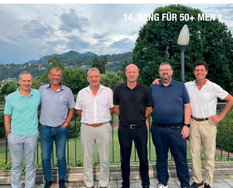
14. RANG FÜR 50+ MEN 1