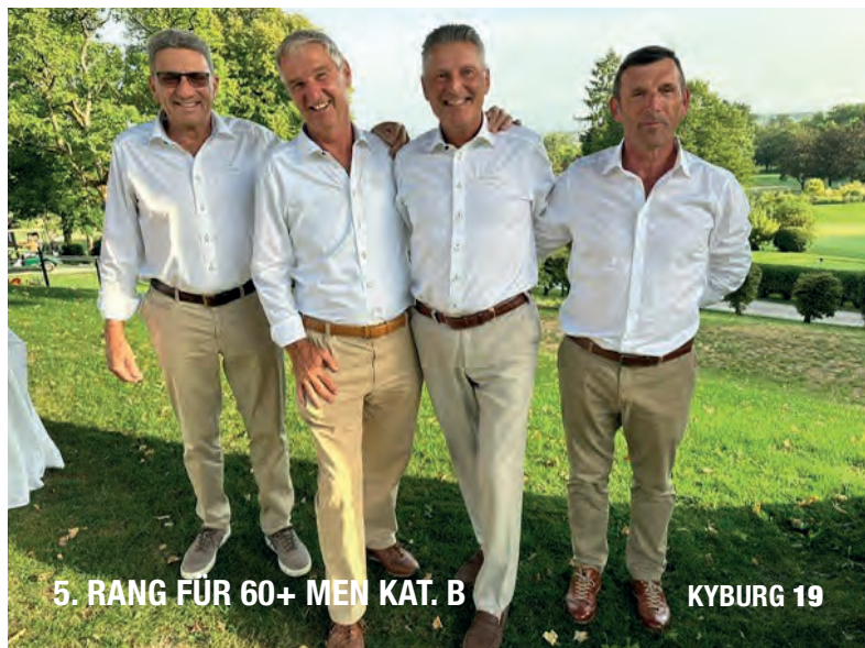
5. RANG FÜR 60+ MEN KAT. B