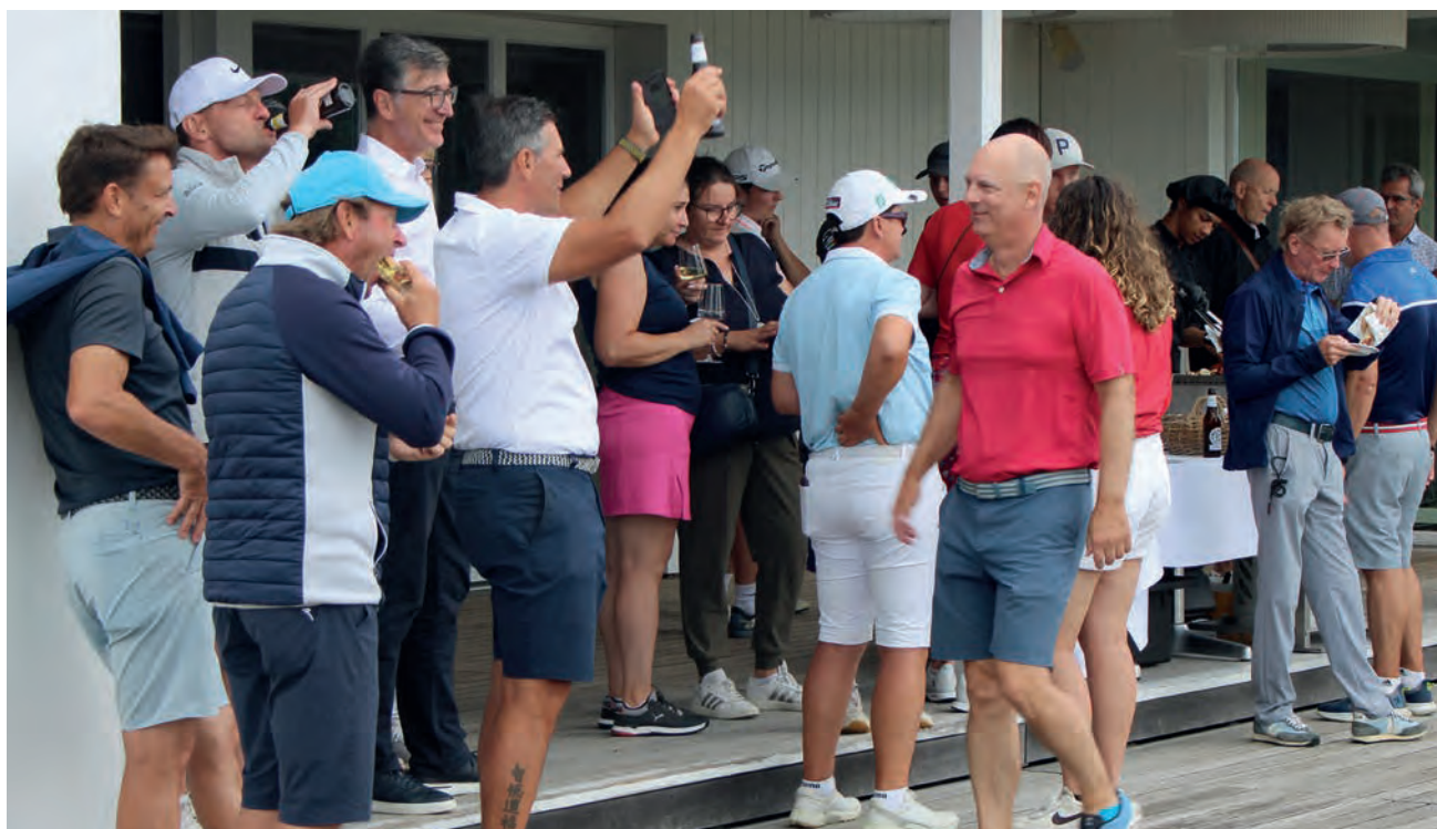
Beim 18. Grün versammelten sich die Spielerinnen und Spieler sowie die Zuschauer, um in entspannter Atmosphäre die letzten Spielzüge der Siegerflights zu beobachten.