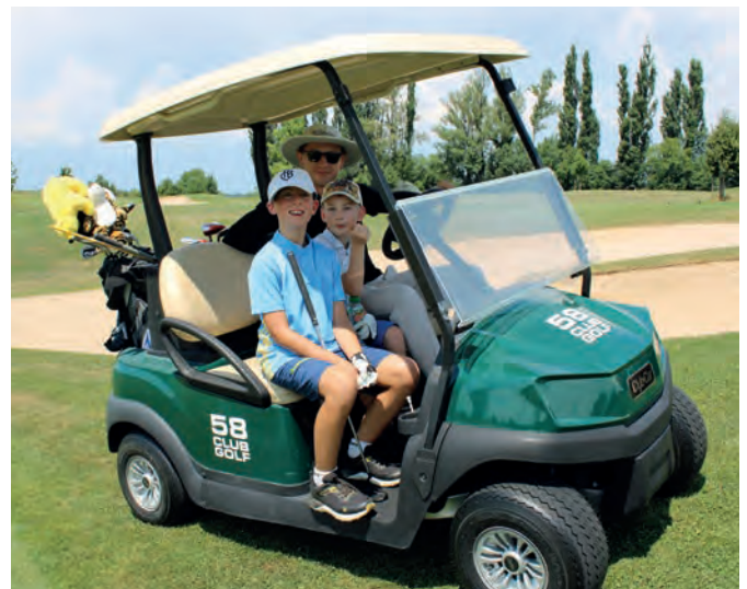
Spiel und Spass im Summer Camp auf Golf Saint Apollinaire im Juli 2025