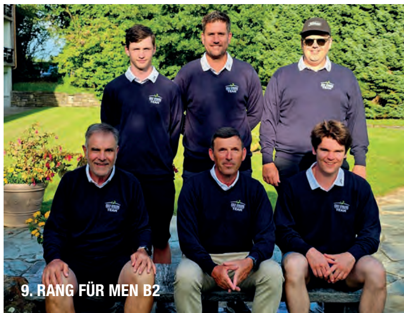
9. RANG FÜR MEN B2