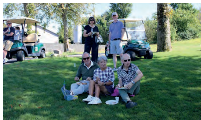
Die Zuschauerinnen und Zuschauer genossen die köstlichen Grilladen, während sie das Turniergeschehen gespannt verfolgten.