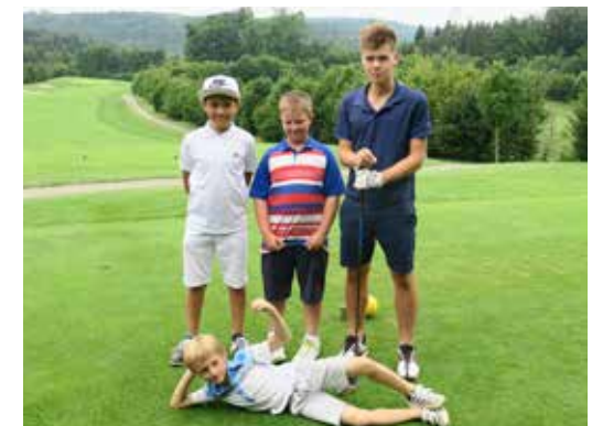
Junioren Summer Camp vom Juli 2016