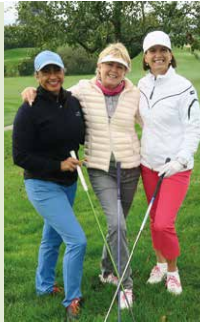
Ladies Herbstturnier vom 04.10.2016