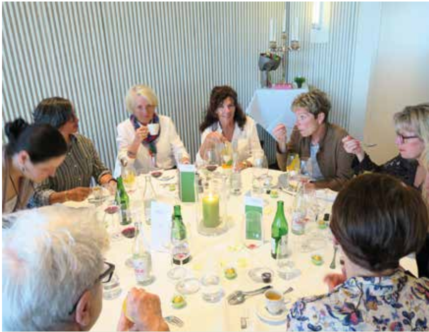
Rege Teilnahme am Ladies Forum 2017.