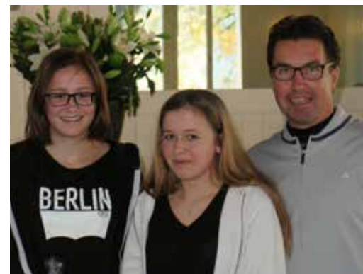
Junioren Seasonend Trophy vom 20.10.2016