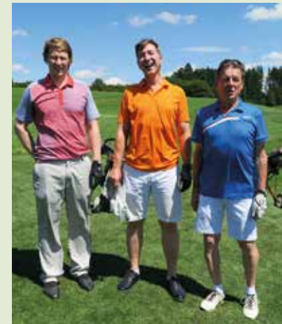
1. ClubGolf Tournament Week vom Juli 2016

In diesem Jahr sind wir mit insgesamt 10 Teams unterwegs, die unseren Club bei Wettspielen repräsentieren.