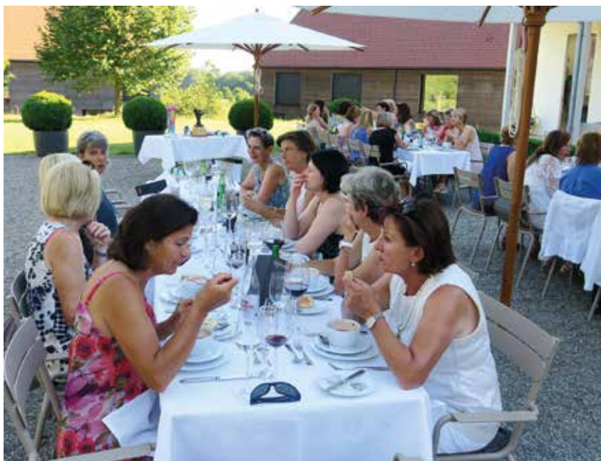
Das verdiente Dinner aus der Küche des Restaurant La Gloria nach der Ladies Captain Challenge 2016.