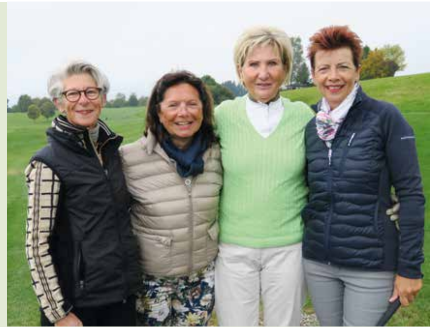
Ladies bye bye Golf Season vom 18.10.2016