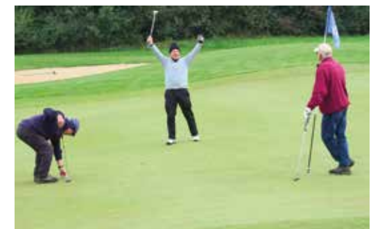
Senioren Freundschaftstreffen mit dem Golf Club Oberkirch vom 14.10.2016.