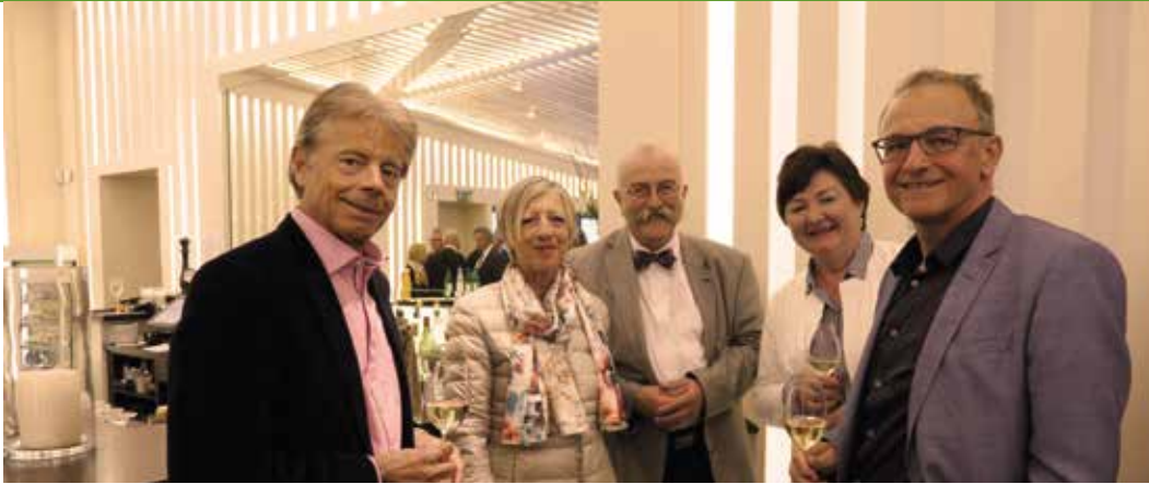
Impressionen der 22. Ordentliche Generalversammlung des Golf Club Sempachersee.