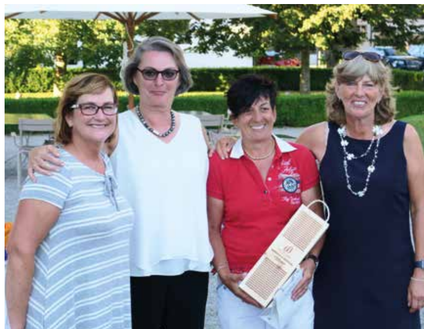
Ladies Sommer Trophy 2016