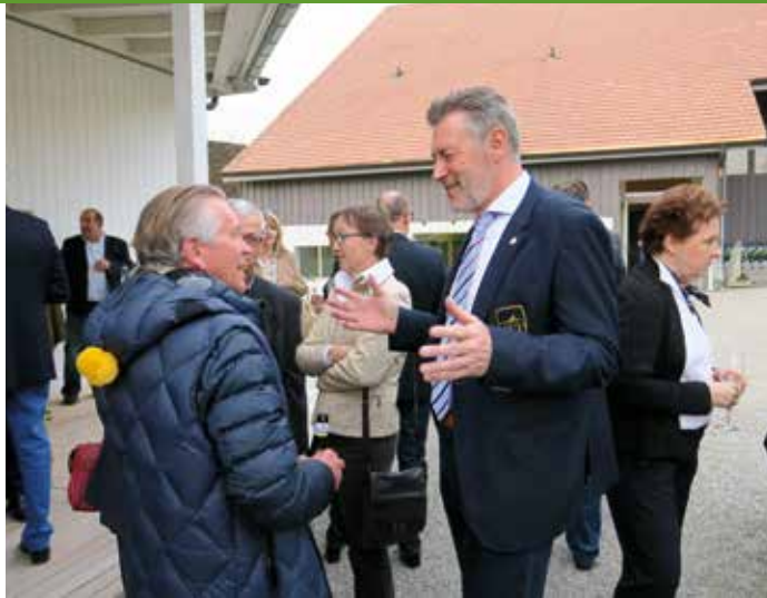
An der Generalversammlung des Golf Club Kyburgs wird auf die neue Golf Saison angestossen.